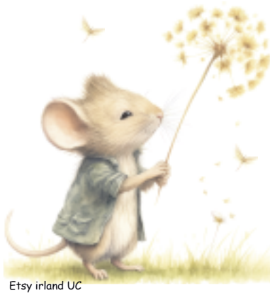
Etsy irland UC

Laternenbasteln: Dienstag, 16. Dezember, 9.30 – 11.00 Uhr