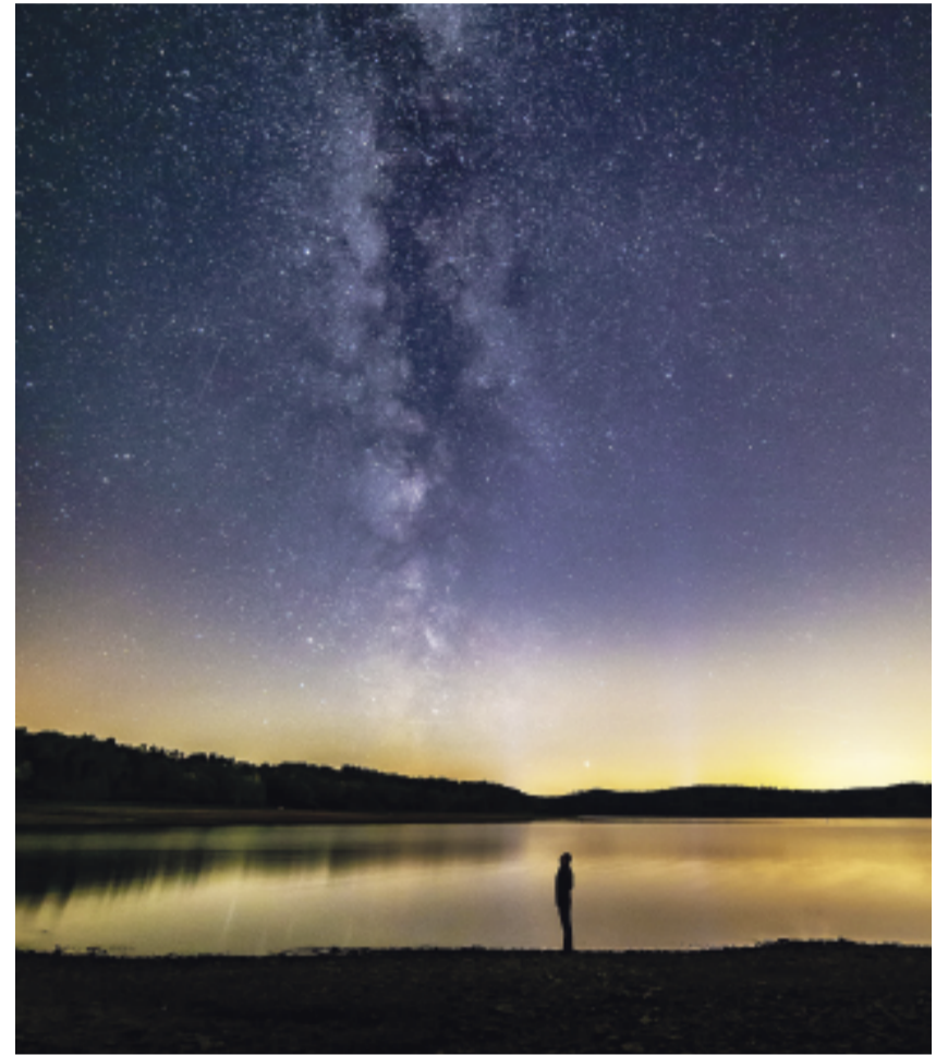
Mensch und Milchstrasse

Es geht um Gerechtigkeit Jesus verkündete ein Gottesbild, das keineswegs harmlos ist. In den Evangelien lesen wir von einem Weltgericht und der Verantwortung, die wir als Menschen für unser Tun haben. Es geht dabei um die Frage nach der Gerechtigkeit. Der Gott der Bibel ist einer, der die Armen, die Unterdrückten und Geschundenen dieser Welt zu ihrem Recht kommen lassen will. Um die Johannesoffenbarung zu verstehen, sollte man sie lesen als eine theologische Interpretation der damaligen Geschichte und der Mächte, die sie lenkten. Kleinasien, das Gebiet der heutigen Türkei, war zu dieser Zeit eine der blühendsten Wirtschaftsregionen des römischen Weltreiches. Der herrschende erste römische Kaiser Domitian (51–96 n.Chr.) bezeichnete sich als «Herr